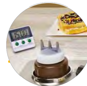
Encastré / Built in