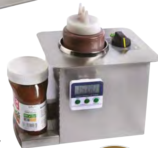
WI / 2 built-in encastrable