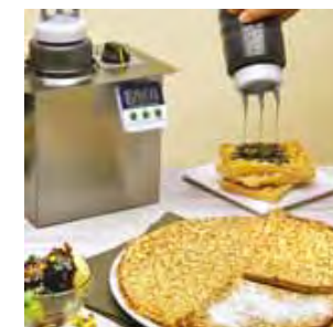
Posé / Table top