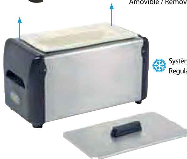
Amovible / Removable