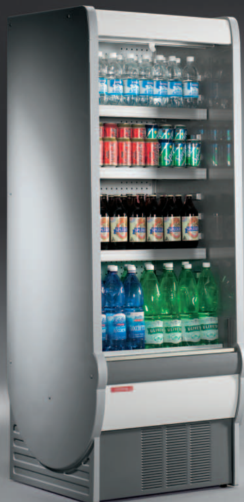
fiancata standard standard endwall joue standard Standard-Seitenteil lado estándar Стандартная боковина